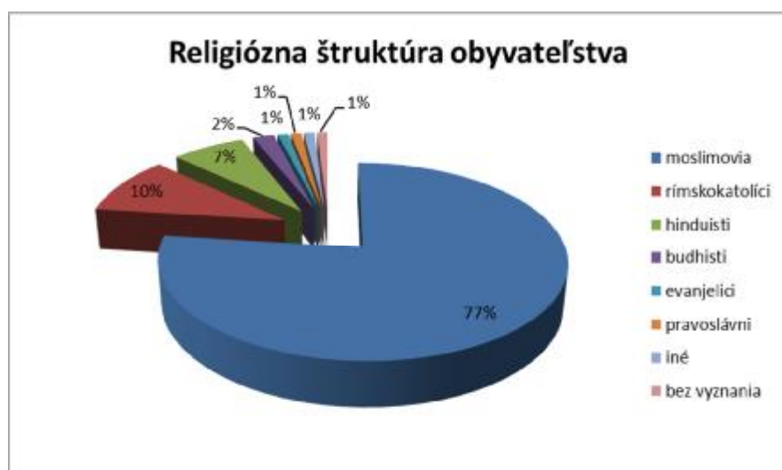
Graf č. 3 – Religiózne zloženie obyvateľstva SAE(rok 2013)

http://en.wikipedia.org/wiki/United_Arab_Emirates