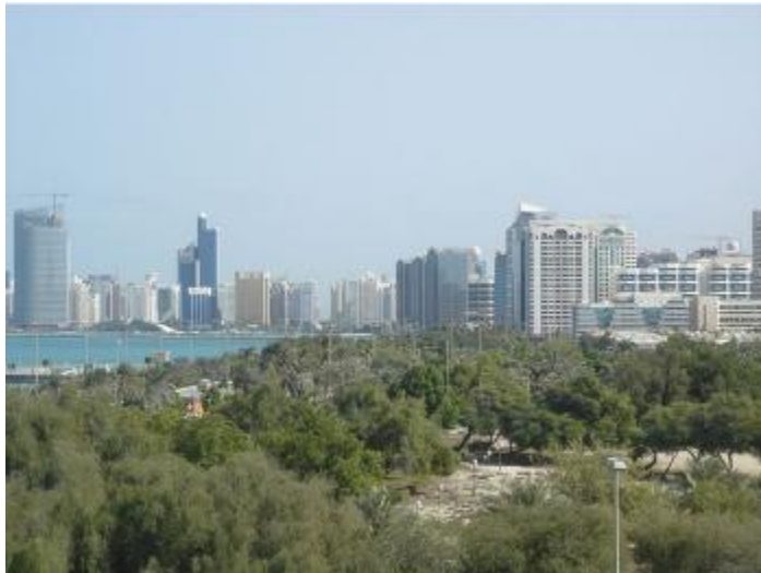
Obr. č. 2 – Mesto Abú Zabí s množstvom kontrastov.

( http://upload.wikimedia.org/wikipedia/commons/thumb/8/83/AbuDhabi02.JPG/800px-AbuDhabi02.JPG )